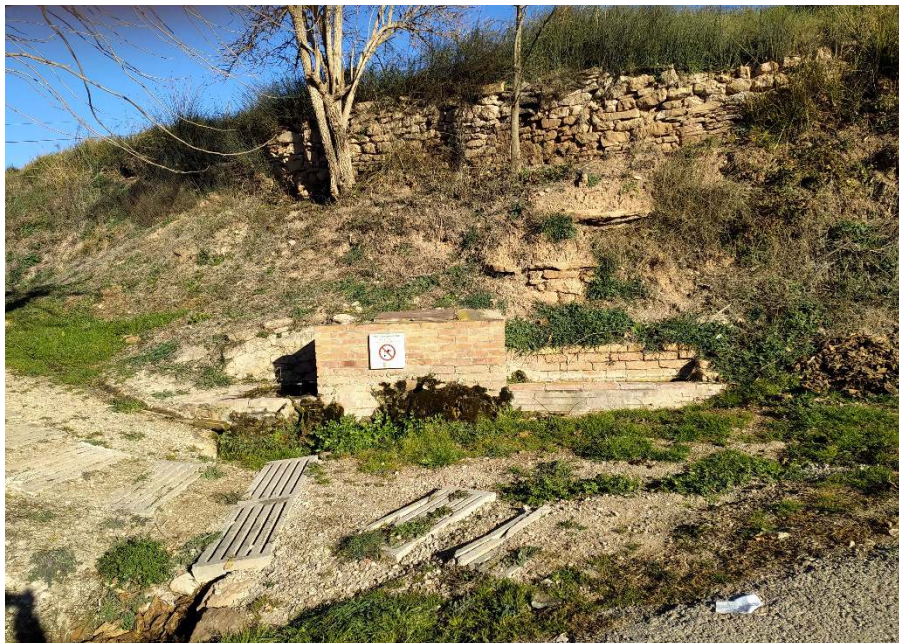
La Font de Fonollosa. Lloc que fou bombardejat pels feixistes el maig de 1938.

A més de les quatre cartes i del poema també s'han conservat dues poesies més. Una amb el títol de "Poema" està datada el dia 1 de març de 1938 i es refereix a les seves penes i també parla amb gran sentiment de la família i de la seva promesa. L'altra poesia té per títol "En recordança a la meva amiga Rosita" i està dedicada a la que serà la seva esposa i expressa l'enyora i el sentiment amorós de l'amic. No està datada però segurament que també és d'aquells mesos d'emboscament. No reproduïm aquestes dues poesies perquè hem considerat que tenien un caràcter íntim.